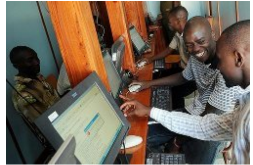
Le premier cybercafé à sa destination finale utilise par des uagers ravies d'avoir accès à Internet en zone rurale