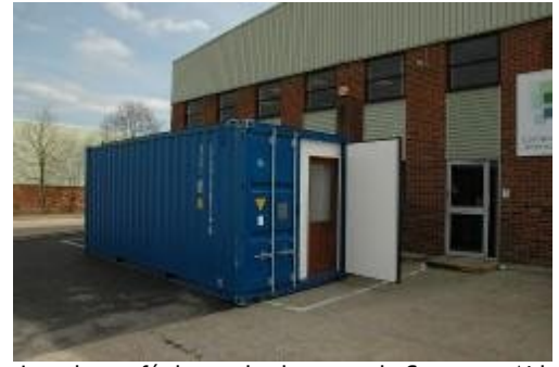
Le cyber café devant les bureaux de Computer Aid à Londres avant son départ pour l'Afrique

Le cybercafé est munie d'un ordinateur fonctionnel composé d'un réseau de onze écrans plats connectés à un Pentim 4 aux spécifications avancées. Des panneaux solaires placés sur le container alimentent le tout. Le cybercafé solaire se trouve à plus de 70 km de la route goudronnée la plus proche en plein coeur de la Zambie.