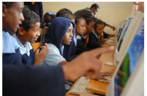
Salle informatique d'une école en Ethiopie équipée d'ordinateurs de Computer Aid

Les écoles et universités les plus prestigieuses d'Afrique mais aussi des établissements scolaires ayant des ressources financières limitées sont déjà équipés d'ordinateurs fournis par Computer Aid.