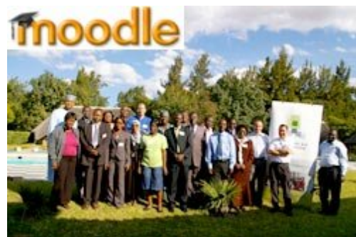
Computer Aid en Zambie formant des responsables d'établissements scolaires à l'utilisation de Moodle Mai 2010

Moodle est une plateforme d'apprentissage en ligne Open Source servant à créer des communautés d'apprenants autour de contenus et d'activités pédagogiques. De tels systèmes de e-formation sont aussi appelés dispositifs de « formation ouverte et à distance » ou, de manière plus académique, « environnements d'apprentissage médiatisé ». Moodle connaît un succès grandissant puisque plus de 70% des établissements scolaires dans les pays du Nord l'utilisent déjà. Il suscite un intérêt grandissant en Afrique mais très peu de gens savent s'en servir.