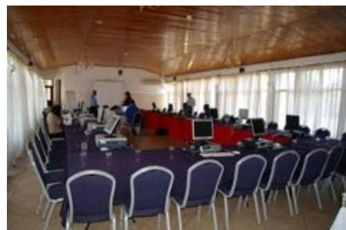
Salle de conférence où Computer Aid assure des ateliers de formation sur Moodle en Zambie