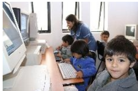
Jardín digital, Santiago de Chile Para más información haga click aquí