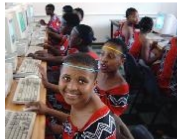
Sala informática con computadoras de Computer Aid, Kenia

El documental consistió en la visita al colegio Saint Charles Lwanga en Mombasa, Kenia, receptor de un ordenador personal de Computer Aid. La BBC recibió una recepción cálida de los alumnos y del cuerpo docente que cantó una canción conmemorando al presidente de los EEUU Barack Obama, cuyo padre viene de la misma tribu que el 80% de los alumnos. La sala informática del liceo ha experimentado un éxito sin igual, ya que cada vez más alumnos quieren asistir a sus cursos de informática.